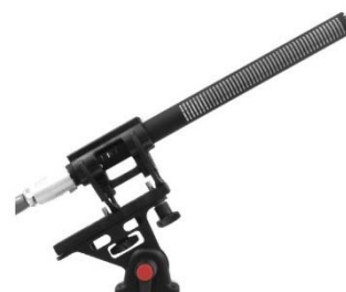
CS-2 (подвес в комплект не входит)

Узкая направленность и выдающаяся чувствительность (63мВ/Па) позволяют качественно снимать звук с больших расстояний. Это открывает новые возможности для репортажной работы.