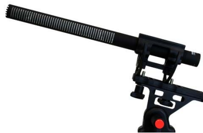
CS-3e (подвес в комплект не входит)

Популярный микрофон CS-3e выделяется среди микрофонов-пушек тем, что он поддерживает узкую направленность в чрезвычайно широком диапазоне частот, что особенно заметно при сравнении с другими микрофонами в области низких частот. Благодаря своей уникальной конструкции CS-3e является отличным выбором для использования в тяжёлых условиях, таких как работа из положения от потолка или из точки, расположенной вблизи шумной камеры. В сложных ситуациях, из-за отсекаемых приходящих с боков и тыла звуковых волн, микрофон помогает захватить целевой диалог без окружающих проблем, создаваемых реверберацией помещения. CS-3e облегчает съёмку сцен, где необходимо сочетать работу с актёром с разных расстояний (включая очень близкое) – смена позиции практически не изменяет общий характер звучания.