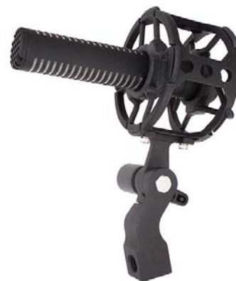
CS-M1 (подвес в комплект не входит)