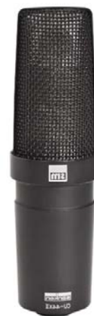
CU-44X MK II

CU-44X Mk II – микрофон с двумя конденсаторными капсулями. Имеет современный бестрансформаторный конструктив. Микрофон обеспечивает прекрасную переходную характеристику, природное и неокращенное звучание. Микрофон дает отличный материал для широкого круга приложений в области музыки, телевидения и студий озвучания кино.